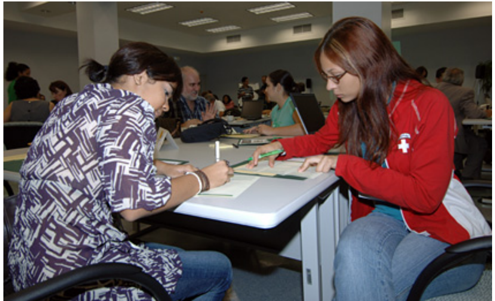
El pasado semestre se llevó a cabo el Primer encuentro de relación estudiante-facultad con el fin de explorar estrategias para mejorar la interacción entre alumnos y profesores.