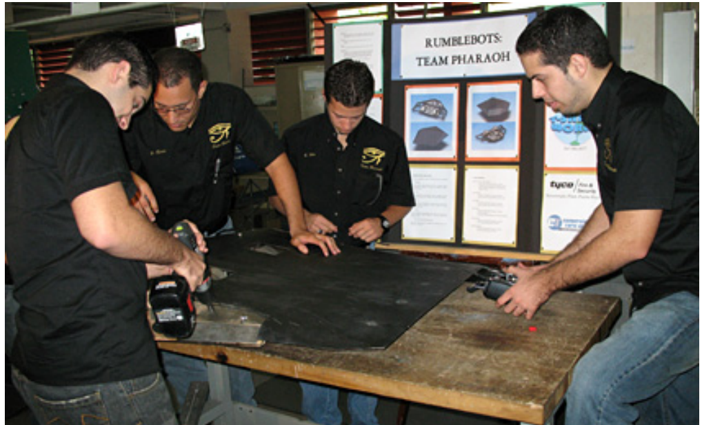
Los estudiantes del RUM sobresalen en sus habilidades para el trabajo en equipo.